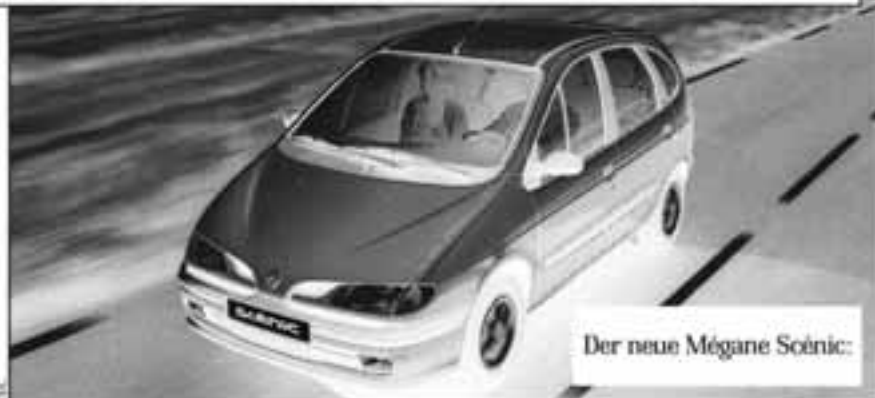
Der neue Mégane Scénic: