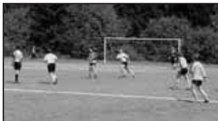
Der Endspiel-Tag der Sportwoche 1997 in Bildern.

einen akuten Spielermangel, wobei die noch aktiven Spieler im besten Fußball-Alter waren. Auch im Jugendbereich war eine Erneuerung notwendig. Nach einigen Vorgesprächen der Vorstände in Kirchen und Freusburg entschied sich der TuS Freusburg, der auch mit dem VfL Wehbach Gespräche über eine Spielgemeinschaft geführt hatte, für Kirchen als Fußball-Partner. Interessant ist der Grund, der zu dieser Entscheidung geführt hat: Der Modus